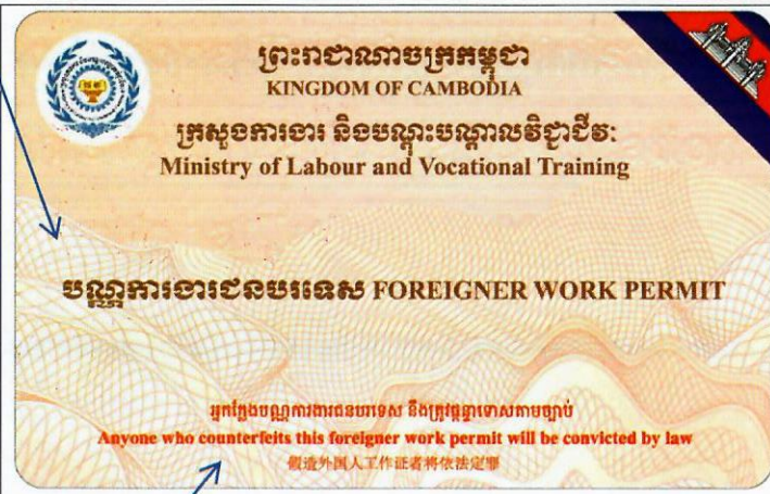
ប្រើប្រាស់នូវពណ៌ OVI ចំណាំដង្ហាត

ប្រើប្រាស់នូវបន្ទាត់សុវត្ថិភាពដើម្បីការពារក្លែងបន្លំ